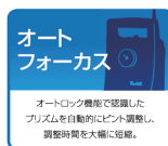
オートフォーカス