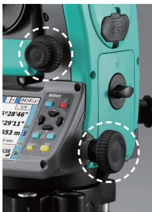
エンドスクランプ (水平・高度)を採用