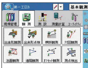
メニュー画面 アイコン表示 タッチパネルで操作