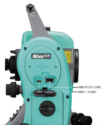
USBケーブル、 USBメモリーでの 通信が可能